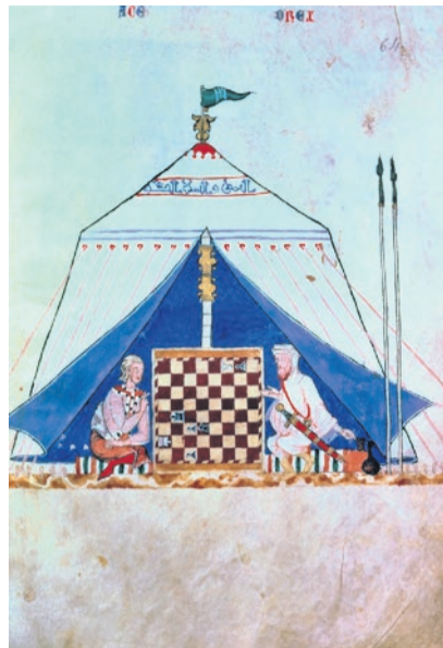
«Ein Maure und ein Christ spielen Schach» Aus dem «Book of Games, Meisterdrucke-1421947».

Bei den Themen Migration und Asyl haben wohl die meisten von uns die Tendenz, damit zuerst «das Fremde» oder «Andere» zu verbinden. Tatsächlich gibt es nicht nur von Mensch zu Mensch, sondern auch von Kultur zu Kultur Aspekte, die sehr verschieden sein können – eine grundlegend andere Sprache wie Tibetisch oder eine ganz andere Hautfarbe oder eine total verschiedene Art, Trauer zu zeigen. Aber manchmal verstellt diese (erwartete, angenommene) Verschiedenheit den Blick aufs Gemeinsame – im Grossen, Wichtigen, aber eben auch in den vielleicht eher nebensächlichen Dingen: Ich erinnere mich gut an meine erstaunte