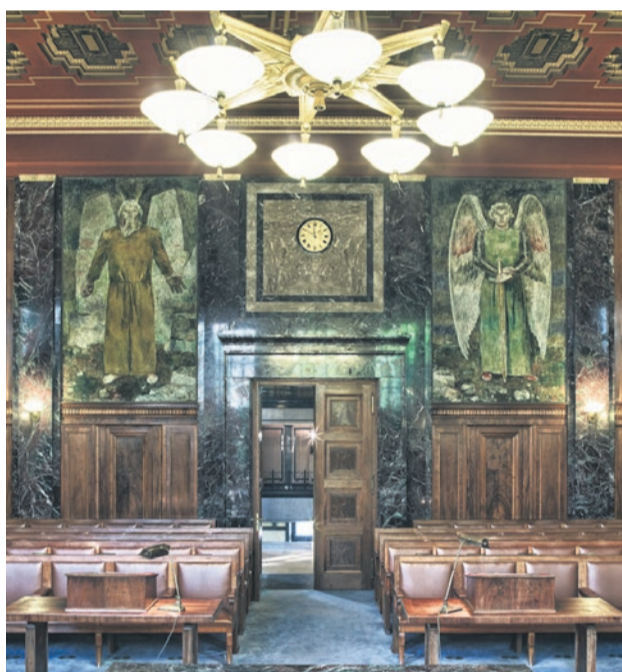
Bild: Bundesgericht Lausanne, Grosser Gerichtssaal